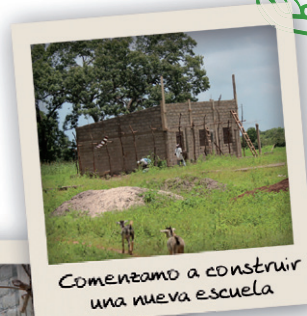
Comenzamos a construir una nueva escuela

Avances del aula que comenzamos a construir en el 2012.