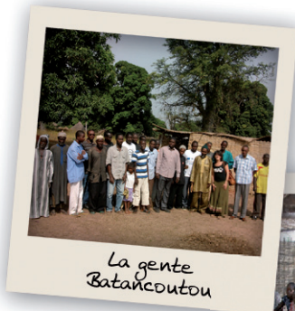
La gente Bantankoutou

El pueblo de Bantankountou y la antigua escuela de chamizo