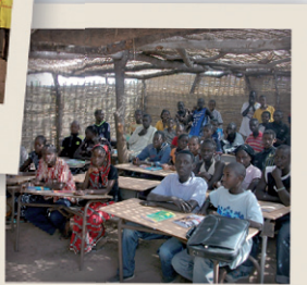
Los alumnos del colegio

El pueblo de Bantankountou y la antigua escuela de chamizo