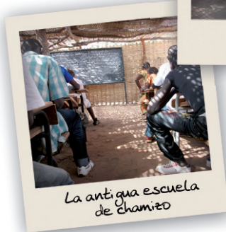
La antigua escuela de chamizo