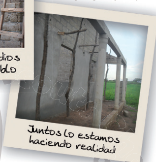
Juntos lo estamos haciendo realidad