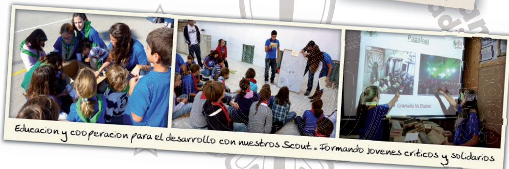
Educación y cooperación para el desarrollo con nuestros Scout. Formando jóvenes críticos y solidarios