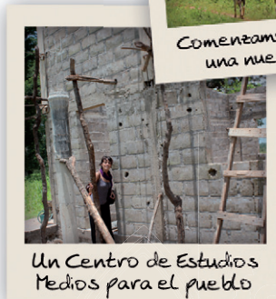
Un Centro de Estudios Medios para el pueblo

Avances del aula que comenzamos a construir en el 2012.